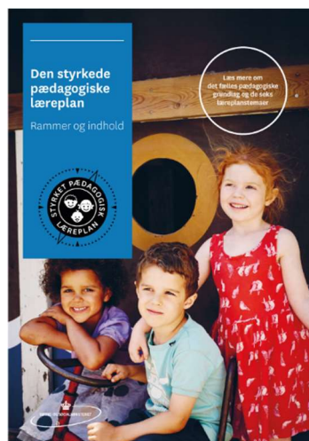
Den styrkede pædagogiske læreplan, Rammer og indhold

Inden for de krav, der følger af dagtilbudsloven, er det op til jer at beslutte, hvordan I konkret vil arbejde med den pædagogiske læreplan. Jeres læreplan skal være et dynamisk og meningsfuldt dokument, som peger fremad, og som I kan bruge aktivt i den løbende udvikling af den pædagogiske kvalitet og jeres pædagogiske praksis.