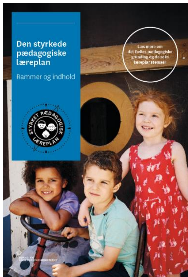
Den styrkede pædagogiske læreplan. Rammer og indhold